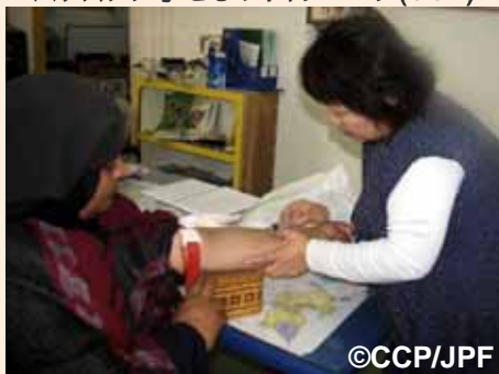
健康診断を実施している日本人看護師:ガザ市