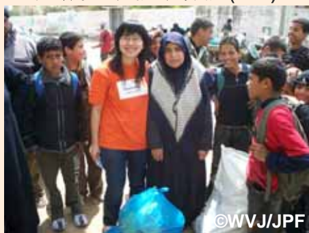
食料を受け取った支援者と喜びの声を聞く(スタッフ:南部ガザ)