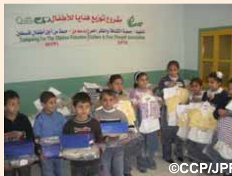
貧困家庭への配布(子どもたちの衣料品):ハンユニス市