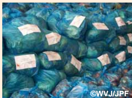
配布を待つWVJ支援物資の食料:南部ガザ