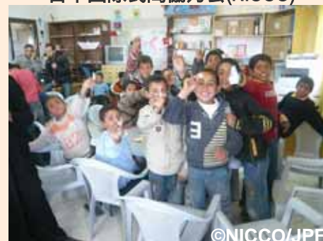
折り鶴が上手にできて大喜びの子どもたち:テルアルスルタン地区