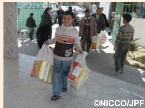
障がい者施設内へおむつを搬入。子どもたちもお手伝い:テルアルスルタン地区