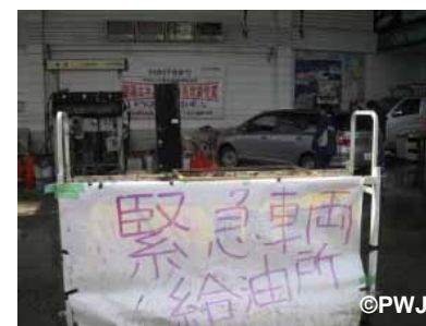
緊急車両用の給油所でのサポート