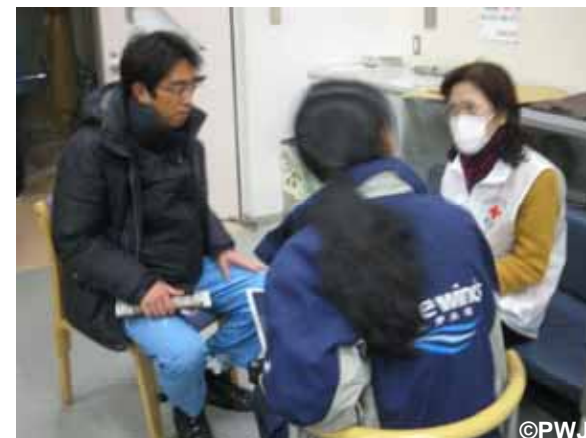
気仙沼市内で赤十字スタッフとミーティング