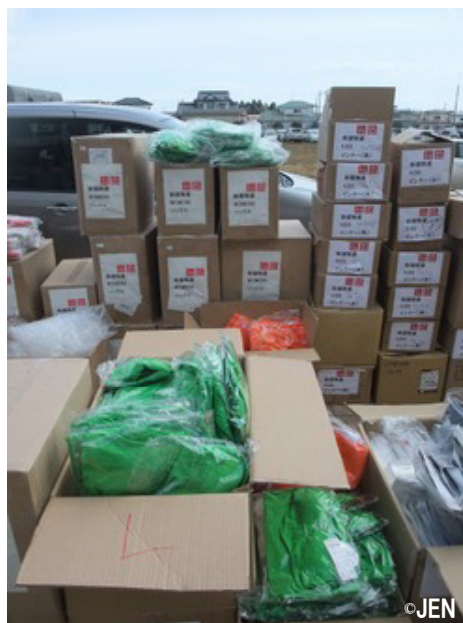
▲ 大曲小学校で配布用に準備したユニクロご提供の衣料

これで、石巻市では3回の物資配布で、合計2,015人の方々に物資をお届けしたことになります。