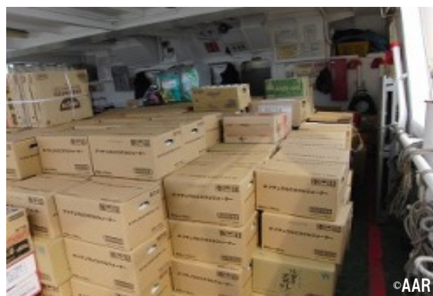
▲ フェリーに積み込んだ網知島への物資

島の港は津波の影響で壊滅状態、電気や水道などのライフラインがほぼ途絶えており、生活も困難な状況です。