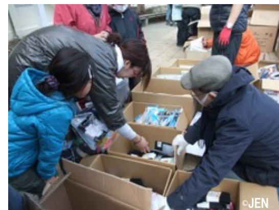
▲ お集まりになった住民の方々物資をお渡しするジェンスタッフ