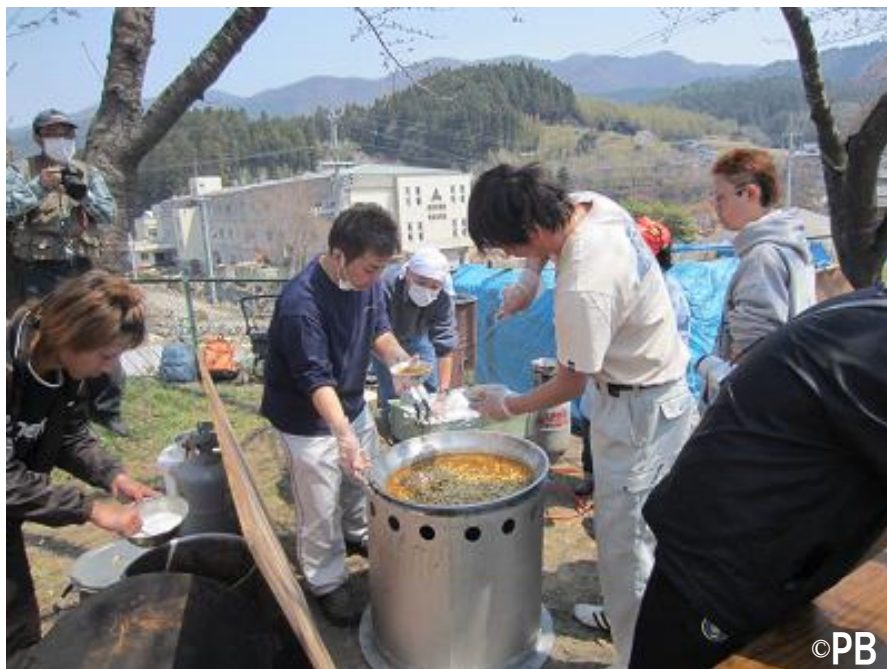
▲ 大船渡市にて、炊き出しにあたり地元の若者の協力を頂きました。