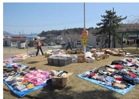
▲ 山田町で行われた物資配布の様子