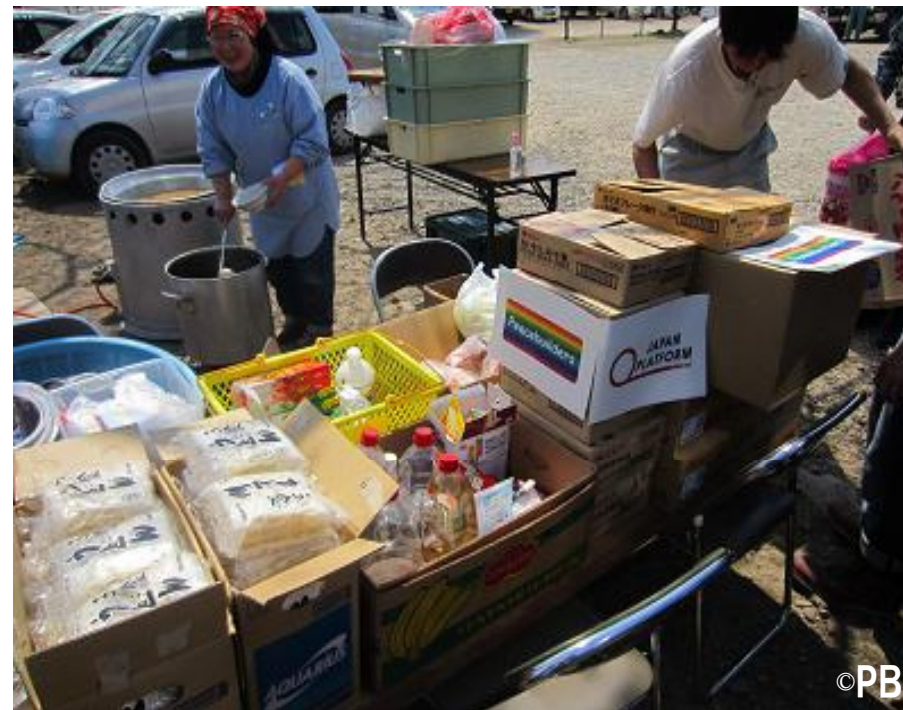
▲ 大船渡市の炊き出しの様子