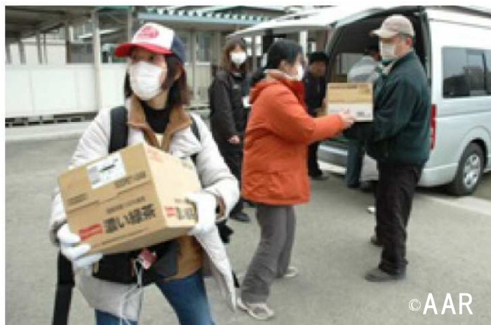
▲ 3月14日、仙台市立中野中学校に500人の方に食糧を届ける

例えば、地震から1週間でAAR(難民を助ける会)が被災地に届けた支援物資は以下の通りです。