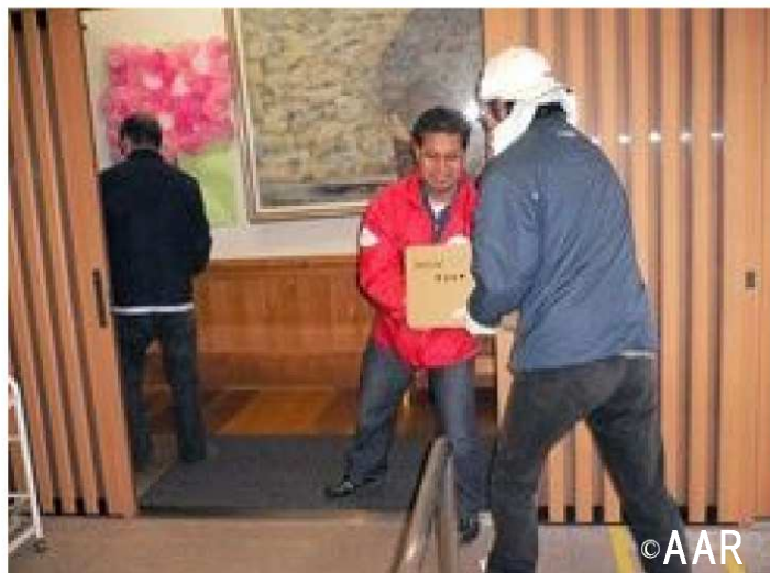
▲ 宮城県柴田郡大河原町の施設「くすのき」にて

避難所となっている学校や障害者施設、高齢者施設など20数か所 石巻市立鹿妻(かづま)小学校(1,600人)、 女川町立第二小学校(約1,500人)、 渡波際(わたのはきわ)地区の民家に避難している方々(約300人)、 山元町の身体障害者更生施設「静和園」(約60人)など