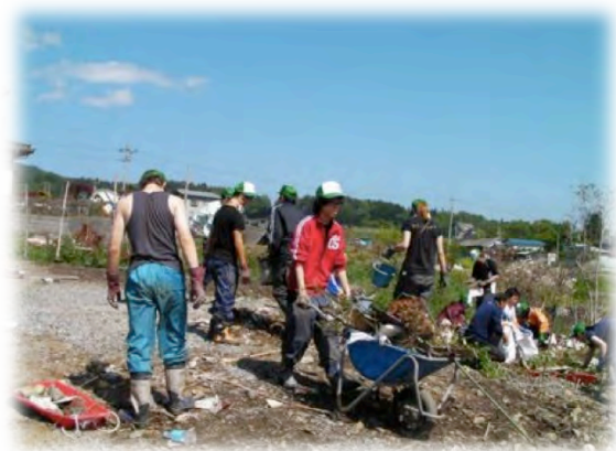
ボランティアによる瓦礫撤去