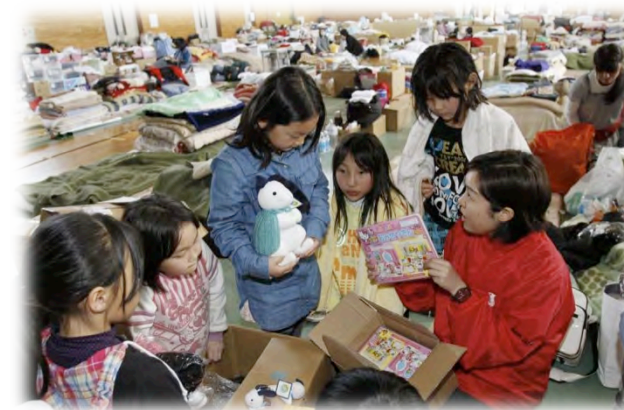
山元町の避難所にて