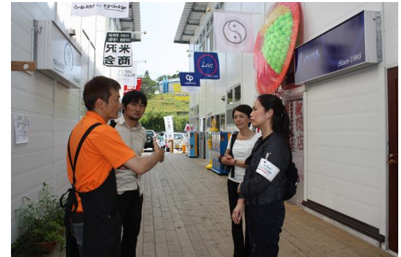
【うれし野こども図書室】岩手県陸前高田市に開設したこども図書館「ちいさいおうち」