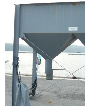
【GNJP : グッドネーバーズ・ジャパン】 岩手県上閉伊郡大槌町漁協復興支援事業