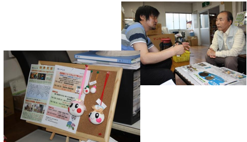
【まちづくり・ぐるっと・おおつち】 被災者が作った人形（販売）と打ち合わせの様子