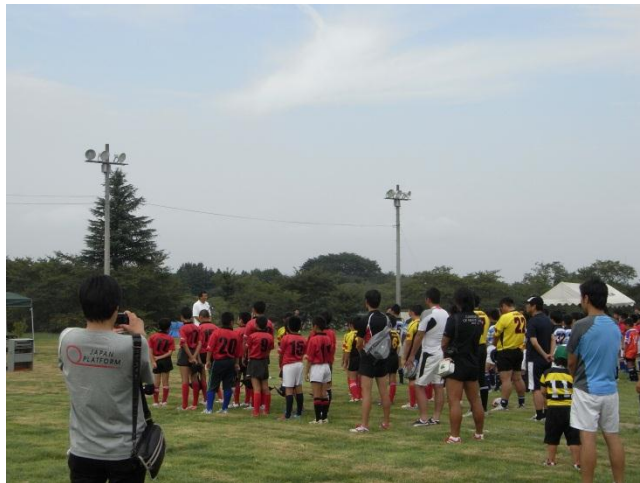
【スクラム釜石】 第1回ともだちカップ（小学生ラグビーチーム） 交流試合・キャンプ実施