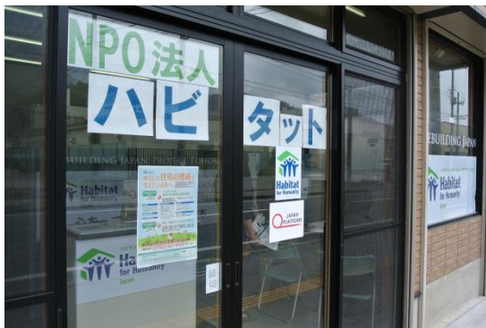
【HFHJ : ハビタット・フォー・ヒューマニティ・ジャパン】 岩手県大船渡市における被災住宅応急修繕事業