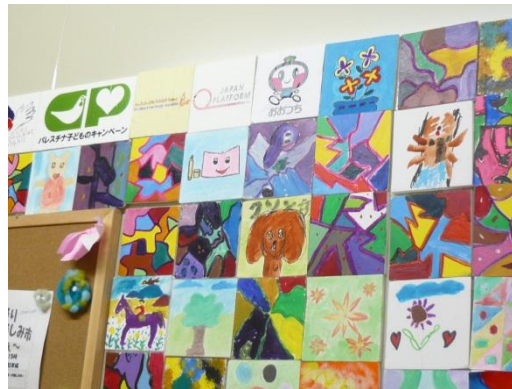
【CCP : パレスチナ子どものキャンペーン】 岩手県大槌町とのコーディネーション による子どものセーフティネット作り とコミュニティ支援