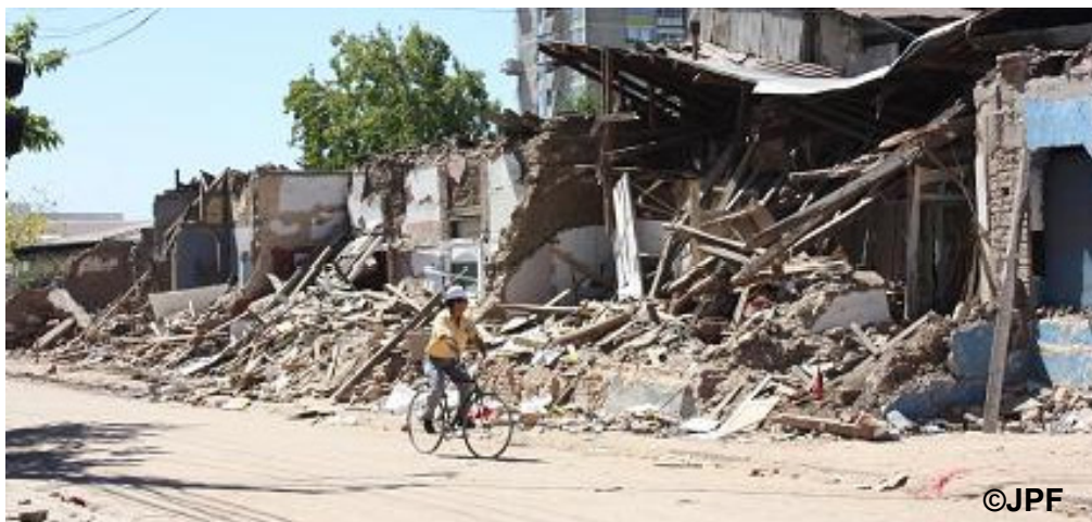
被災地タルカ(Talca)の状況