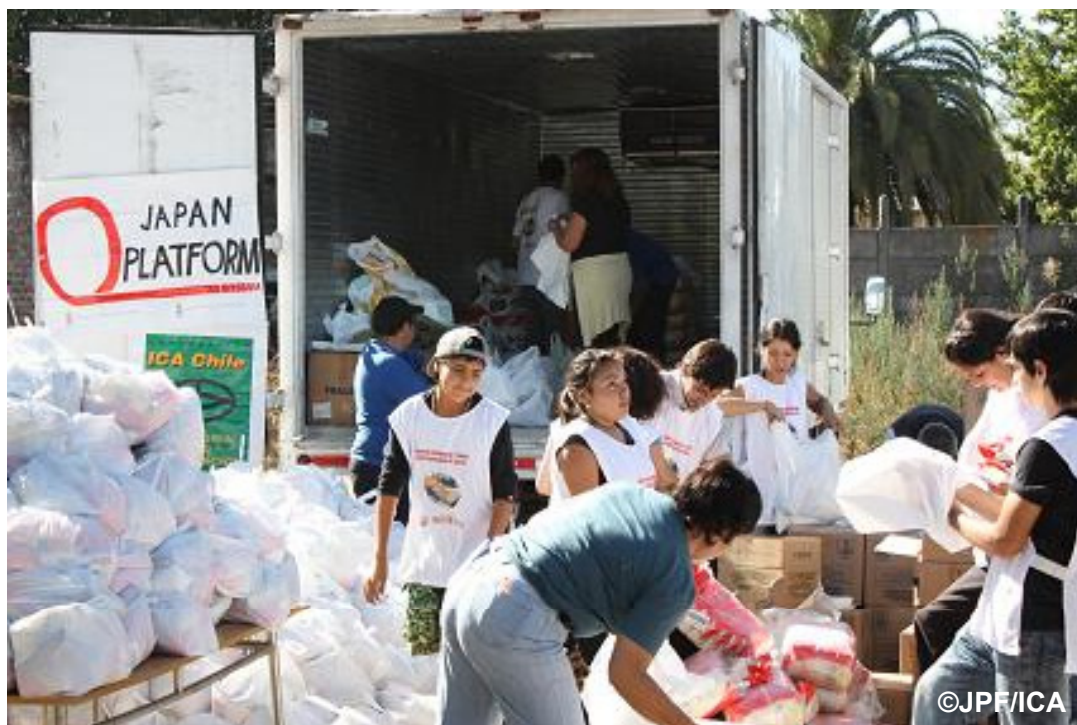
物資配布活動の様子