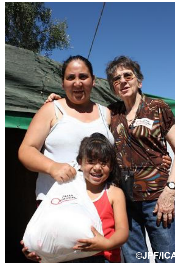
配布物資を受け取り喜ぶ人たち