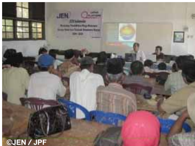
防災教育で地震メカニズムについて学習中