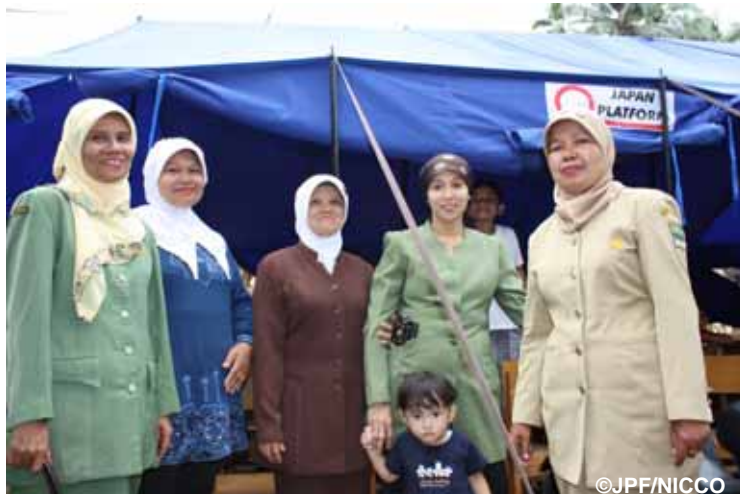
Sdnis V Koto Timur 小学校の先生たち

「JENがこの村で支援物資を配布してくれました。 日本の市民からのFriendshipを感じます。 本当にありがとう。」