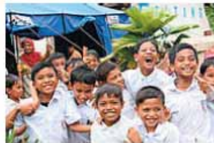
NICCOより配布されたテント前で笑顔の子どもたち=19日、インドネシア・パダンバリアマン

JENはがれきを撤去したり、家屋を修繕するための一輪車や大工道具のほか衛生キットを被災者世帯に配布。また、NICCOは郡部の被災地の巡回医療を実施した。NICCOによれば、被災の精神的ショックによる不安や不眠を訴える住民も相当数に上るといふ。