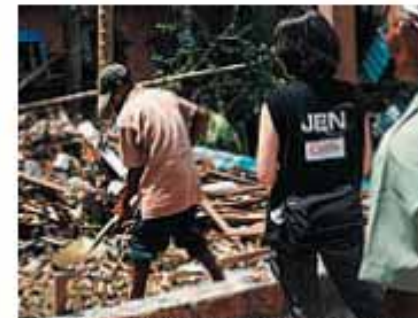
被災者への配布物資の使用状況を確認するJENスタッフ=18日、インドネシア・パダンバリアマン

ジャパン・プラットフォームは官民、非政府組織(NGO)が協力して設立した緊急人道支援組織で、複数のNGOが効果的に活動できるように調整したり、企業・団体からの義援金の窓口となる。今回の地震ではジャパン・プラットフォームと連携し、JENやNICCOなど9団体が被災地の西スマトラ州パダンや近郊パダンバリアマン県で活動を展開している(2団体は既に活動終了)。