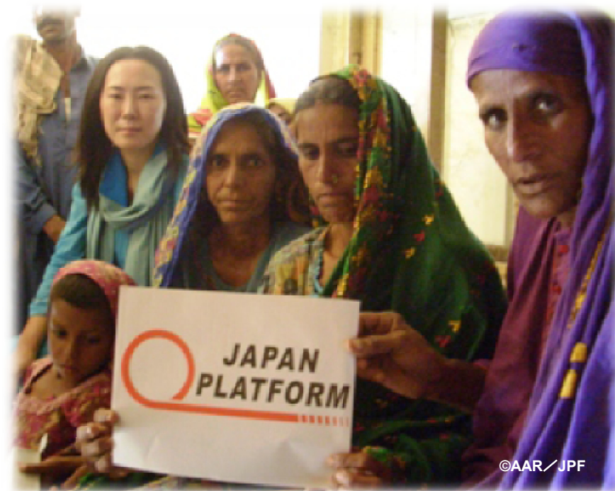
巡回診療チームが訪問した学校にて(スッカー郡)