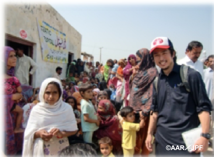
診療所で順番を待つ人々と日本人スタッフ (ムザファルガル郡)