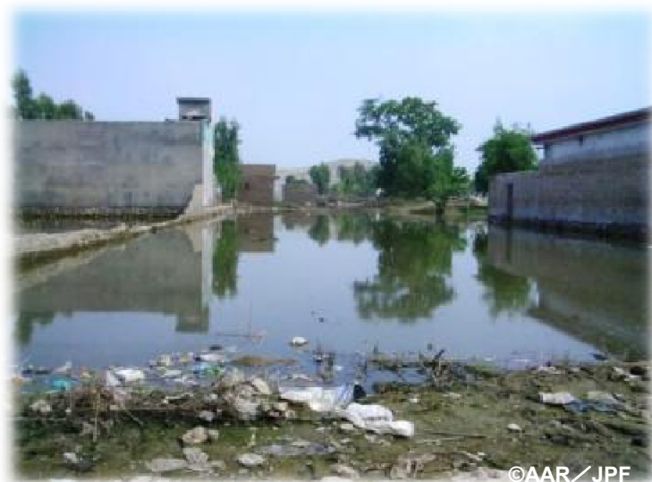
いたるところに残る水たまり(ノウシエラ郡)