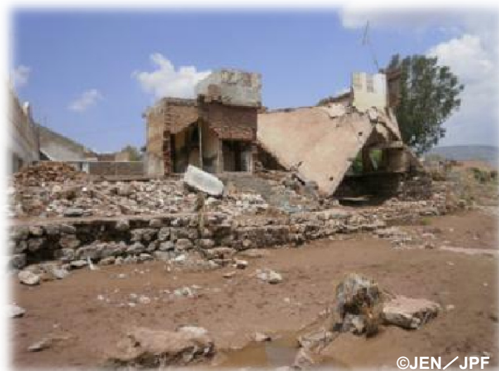
被災した家屋(コハーム県ガムバット村)