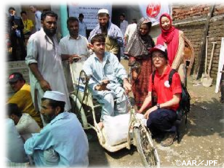
とりわけ障害者は厳しい状況に置かれています