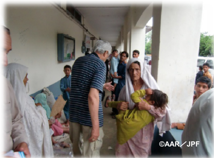
患者でいっぱいのノシエラ郡の臨時診療所