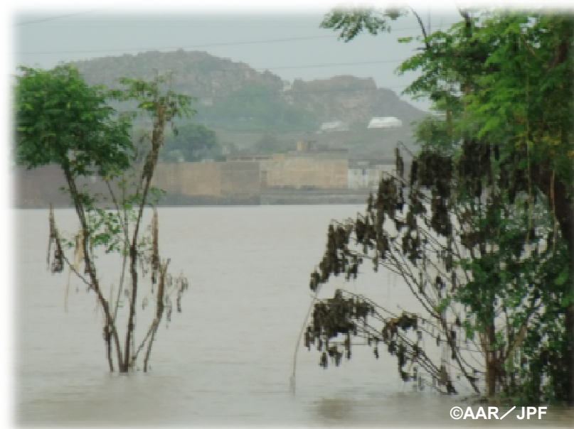
洪水のため耕作地も水浸しになったノシエラ郡の様子