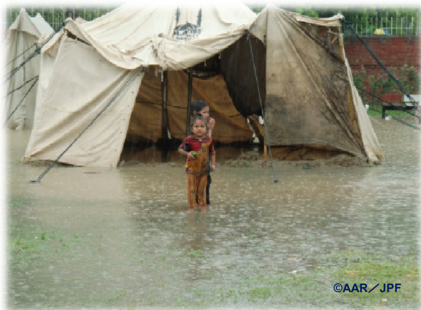
臨時診療所内でテント生活をおくる被災した子どもたち