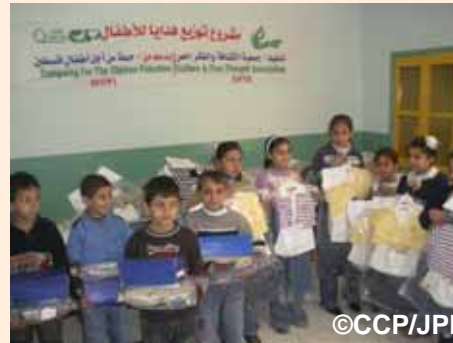
貧困家庭への配布(子どもたちの衣料品):ハンユニス市