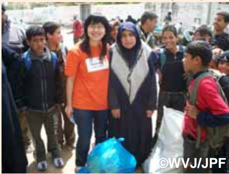
食料を受け取った支援者と喜びの声を聞く(スタッフ:南部ガザ)