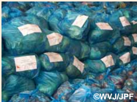
配布を待つWVJ支援物資の食料:南部ガザ