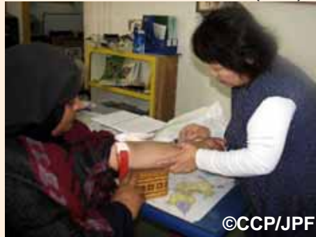
健康診断を実施している日本人看護師:ガザ市