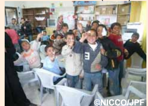
折り鶴が上手にできて大喜びの子どもたち:テルアルスルタン地区