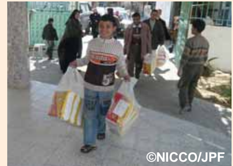
障がい者施設内へおむつを搬入。子どもたちもお手伝い:テルアルスルタン地区