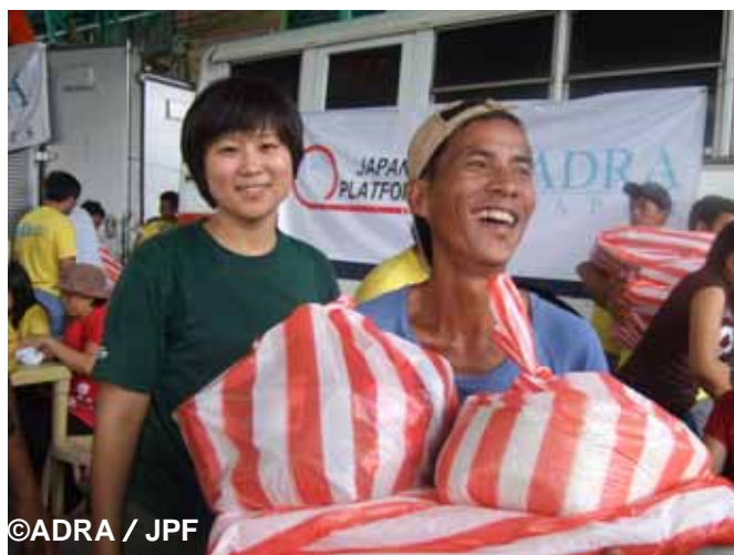
一週間ぶりに食料を手にして嬉しそうな被災者