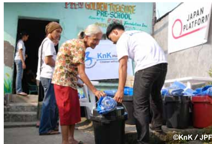
住民の名簿を確認しながら物資を配給する