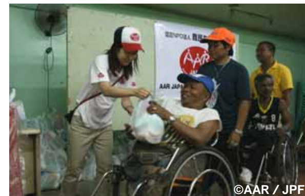
障害者支援施設の利用者や職員に 生活物資のセットを配布