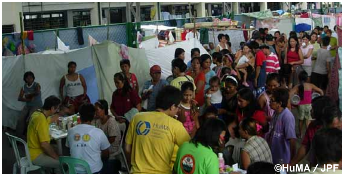
小学校避難所でマニラ保健省と共に避難住民に診療