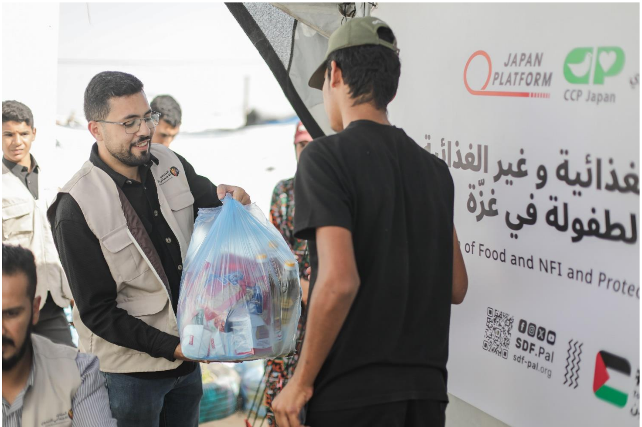
食料・NFI 配布©パレスチナ子どものキャンペーン