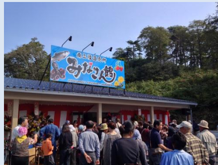
アジア協会アジア友の会： 南三陸直売所みなさん館開所式