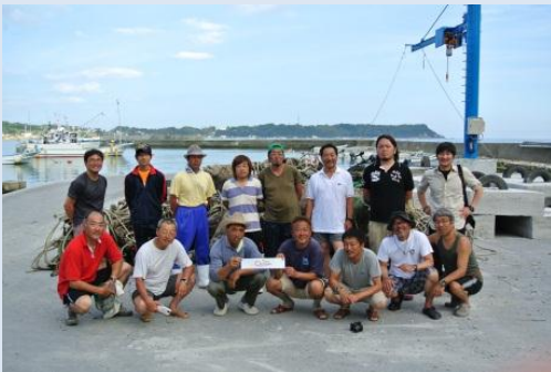
日本安全潜水教育協会： 南三陸町魚場瓦礫撤去・調査後の集合写真

災害対応で必須とされる調整の仕組みの不在をいち早く認識し、多様な支援団体の調整を積極的に行った。