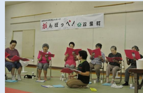
ヒューマンソーシャルハーモニー研究所： 双葉町から埼玉県に避難している被災者対象 のイベント